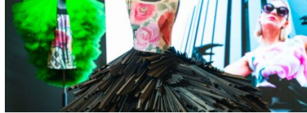
Visti in fiera - La flower atmosphere di Filmar News dalle aziende, Saloni 23 Febbraio 2023