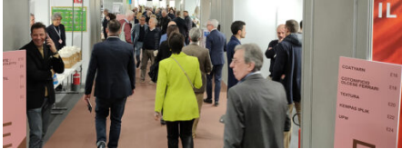
Filo trova conferme, la filatura italiana è viva e forte Daily news, Primo piano, Saloni 24 Febbraio 2023