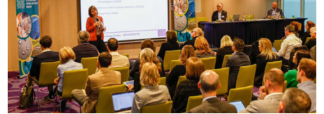
Rifiuti e pmi, arriva un progetto per gestire il riciclo Attualità, Daily news 23 Febbraio 2023