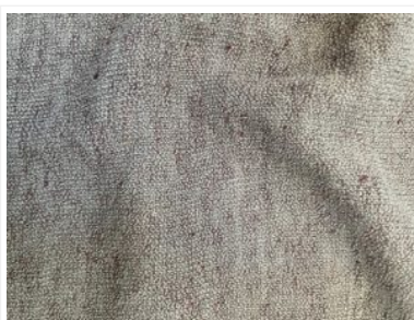
Raipur Cotone Organico

www.servizi-e-seta.com ( http://www.servizi-e-seta.com )