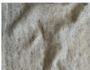
Crepolino Melange 100-Lino